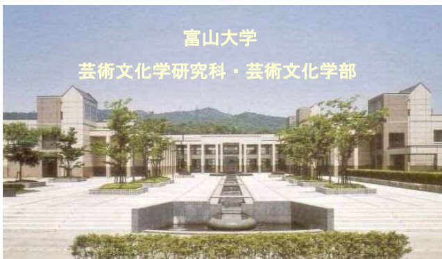
富山大学 芸術文化学研究科・芸術文化学部 (Graduate School of Art and Design Faculty of Art and Design UNIVERSITY OF TOYAMA)

新たな建築文化を作れるかとのテーマですが、今日は 2 つの話をします。1 つは、全国の国立大学で芸術文化学部 という名前の学部はたぶん 1 つだけ。