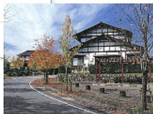
八尾町 上野かざみ台