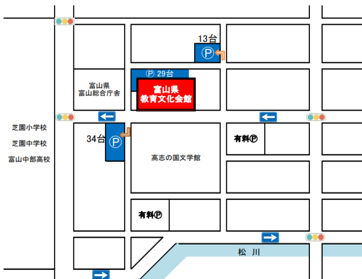
富山県教育文化会館